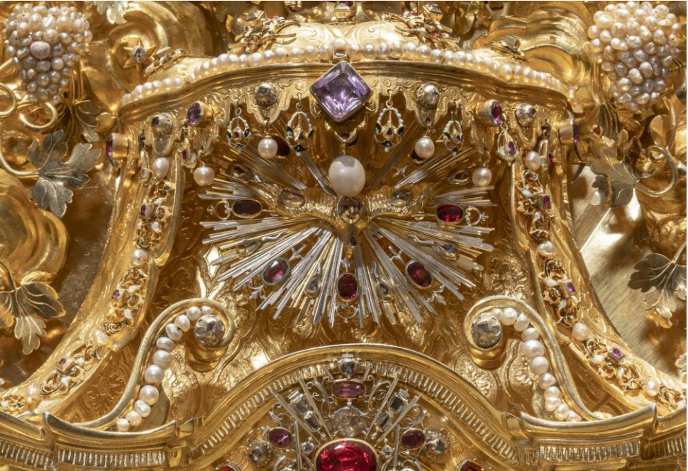
Kaum erkennbar mitten in all dem Gold, den Perlen und den Edelsteinen: die Heilig-Geist-Taube in der Traubenmonstranz aus der Schatzkammer St. Martin

Wenn Sie die Heiliggeist-Taube nicht oder nur schwer erkennen können, die in der prachtvollen Monstranz, dem Prunkstück in der Schatzkammer von St. Martin die Verbindung zwischen der ebenfalls aus Gold getriebenen Figur von Gott Vater und dem Raum für die Hostie (= Jesus Christus, der Sohn) bildet, dann bleibt nichts anderes übrig: Sie müssen Sie direkt in Augenschein nehmen. Herzliche Einladung zur Wiedereröffnung der Schatzkammer im Anschluss an den Festgottesdienst zu Pfingsten in der Stiftsbasilika.