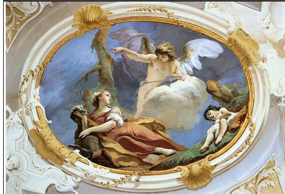
Giovanni Battista Tiepolo, Hagar in der Wüste (1726-29), Bischofspalast in Udine

St. Martin - St. Jodok Hl. Blut - St. Peter und Paul