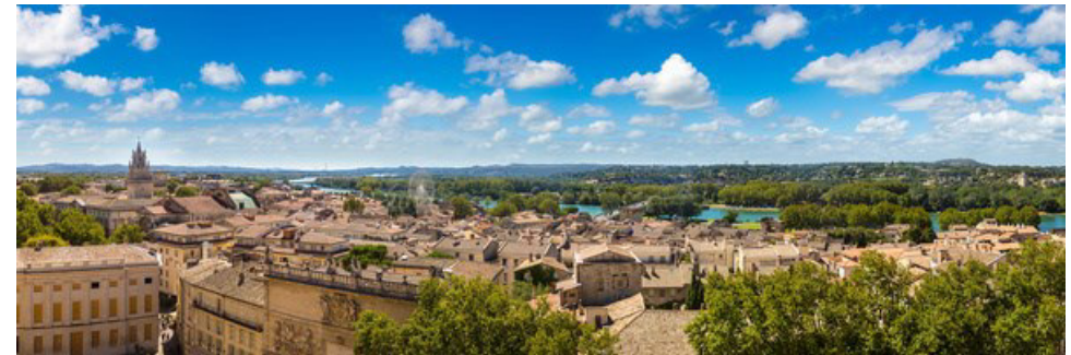
panoramic aerial view of Avignon

Reisedokumente: Mindestens für die Reisedauer gültiger Reisepass oder Personalausweis